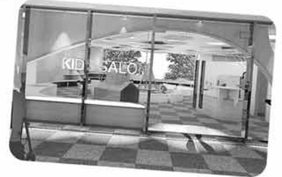
▶入口から中の様子が見えるので、初めて利用する方も安心